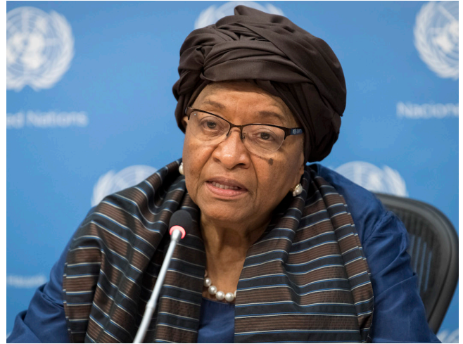
President Ellen Johnson Sirleaf of Liberia

Ce résumé examine le processus de prise d'engagement en soulignant trois formes : l'engagement exprimé , institutionnel et financier , à l'échelle mondiale, régionale, nationale et locale. La prise d'engagement commence par la définition des questions et problèmes sous-jacents qui nécessitent d'être abordés pour améliorer l'accès aux et la qualité des informations et services de planification familiale. Les résultats de recherche sur ces questions sont utiles pour identifier le type d'engagement nécessaire pour aboutir à des améliorations. Le plaidoyer joue un rôle clé dans la prise d'engagements car les parties prenantes peuvent ainsi relier le problème et les données existantes aux investissements spécifiques nécessaires. Une fois prononcés, les engagements sont suivis par les parties prenantes pour s'assurer qu'ils mènent aux améliorations recherchées.