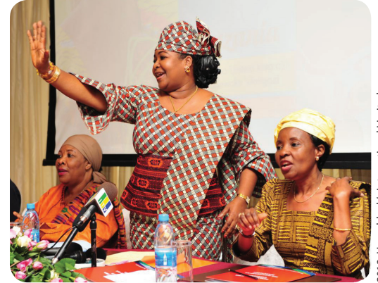
La Première Dame de la Tanzanie, Mama Salma Kikwete, encourage les femmes à utiliser la planification familiale lors du lancement de la campagne nationale pour améliorer la santé des femmes et des filles en 2012.

Il existe toute une gamme de lois, de réglementations, de codes et de politiques affectant les opérations du système de santé, allant de ceux régissant les tarifs de douane, les allocations budgétaires, les offres, et les achats de contraceptifs au niveau ministériel, à ceux influant sur la manière dont le personnel de santé au niveau des soins primaires passent leur temps et la qualité des traitements que les clients reçoivent au niveau des dispensaires. Les obstacles à l'accès aux services de santé de haute qualité sont souvent dus à des politiques non existantes, inadéquates ou conflictuelles (Cross et al. 2001). Les tableaux 1 à 3 fournissent des exemples de trois niveaux de politiques en Asie, en Amérique latine et en Afrique subsaharienne.