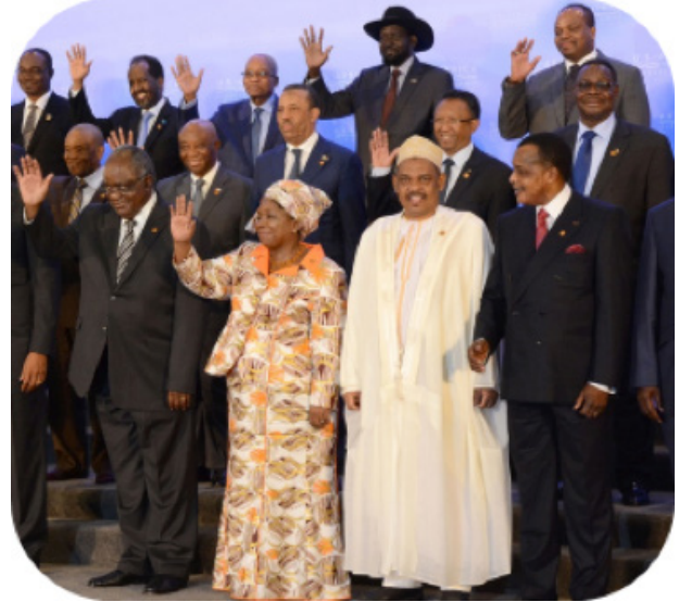
Líderes africanos en la Cumbre, 6 de agosto de 2014

El compromiso demostrable con la planificación familiar fortalece el entorno habilitador en el que se implementan los programas y las políticas. Países tales como Indonesia, México y Turquía tienen compromisos duraderos con la planificación familiar, como lo demuestra su uso de recursos nacionales, el trabajo hacia el fortalecimiento de sistemas en los niveles subnacionales, y los aumentos en las tasas de prevalencia de anticonceptivos (Alkenbrack y Shepherd, 2005; Ozvaris y otros, 2004; Seltzer, 2002). Independientemente de su desempeño anterior, los países pueden sufrir un estancamiento a medida que su compromiso con la planificación familiar disminuye con el paso del tiempo (Putjuk, 2014).